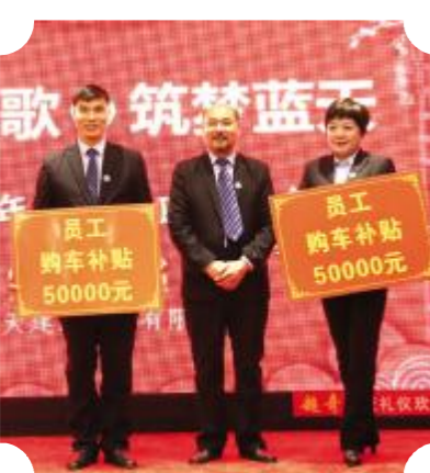
董事长为中层管理人员发放购车补贴五万元