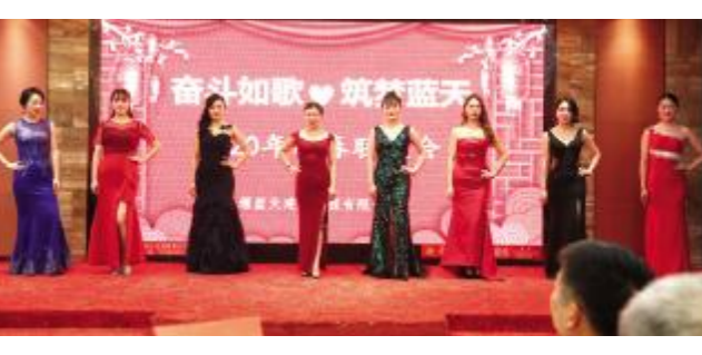
实训楼项目部选送节目 -《时装秀》