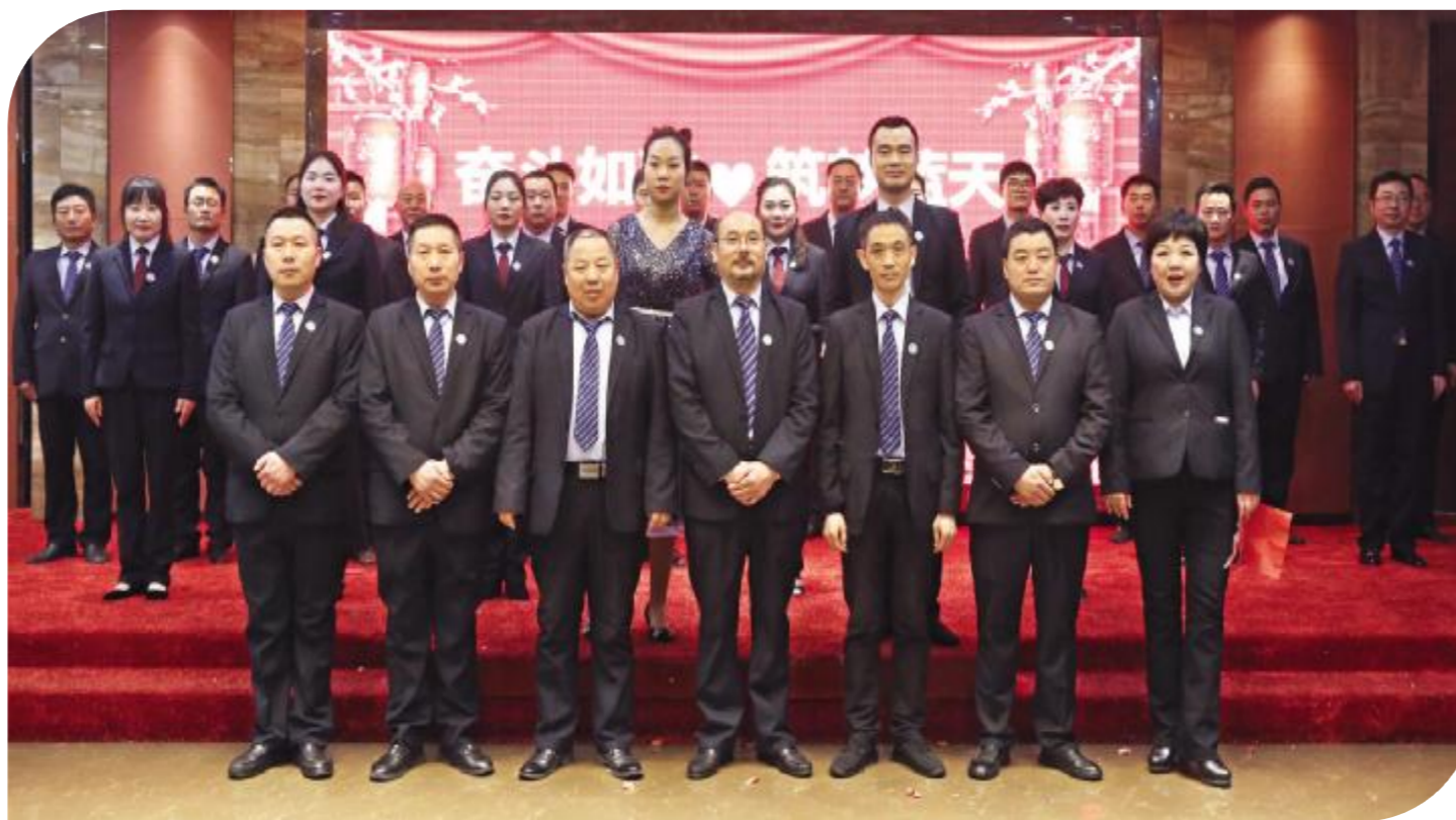
合唱司歌《梦翔蓝天》公司全员合影留念