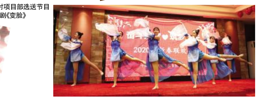
京东路项目部选送节目 - 舞蹈《蝶恋花》