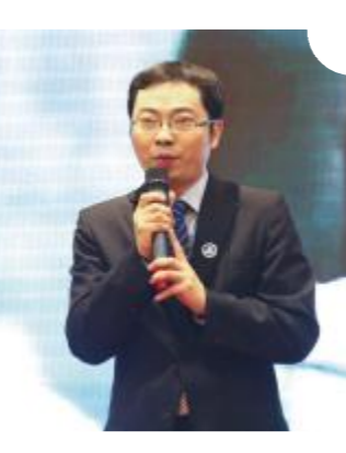
财务部选送男声独唱《翅膀》