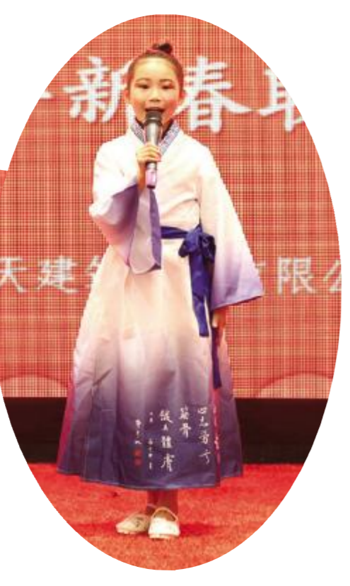
材设部选送节目 - 演讲《汉字瑰宝》