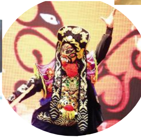
茅塔乡岩屋村项目部选送节目 - 川剧《变脸》