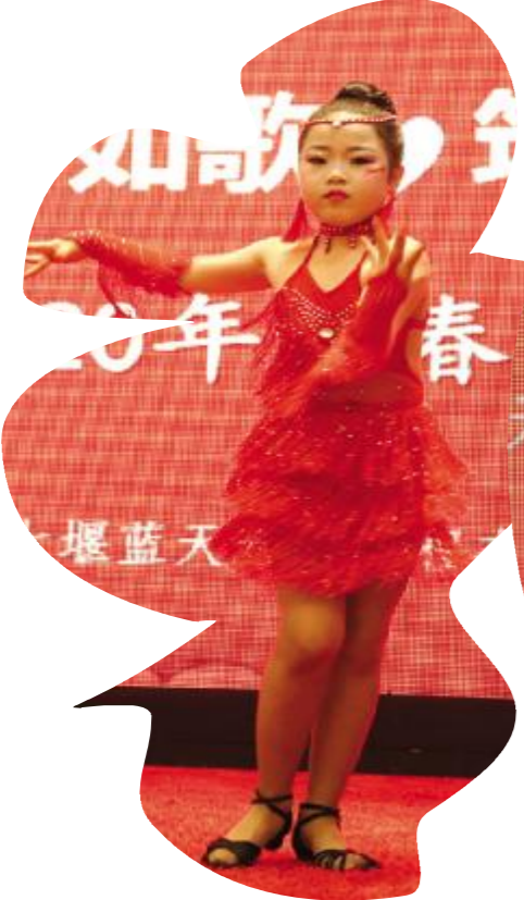
震洋项目部选送节目 热情的《恰恰》