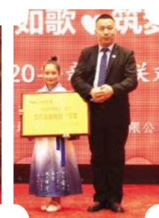
为获得一、二、三等奖的项目部颁奖