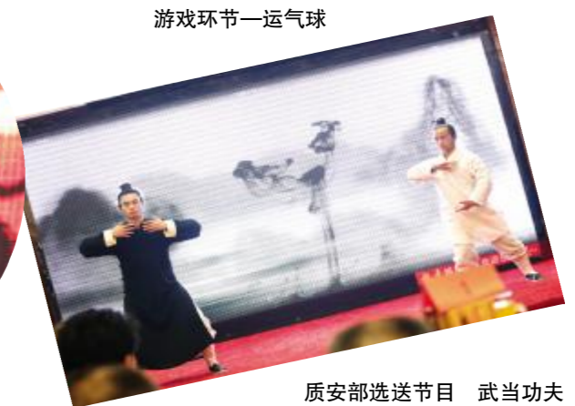
质安部选送节目 武当功夫