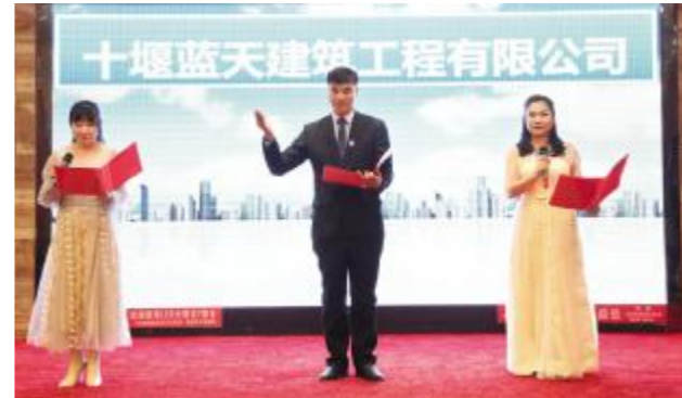
经营部选送节目 - 诗朗诵《蓝天赋》