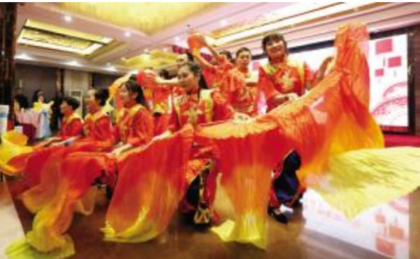
欢乐祥和的-《万象更新》