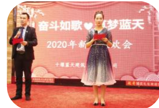
美女、帅哥主持闪亮登场