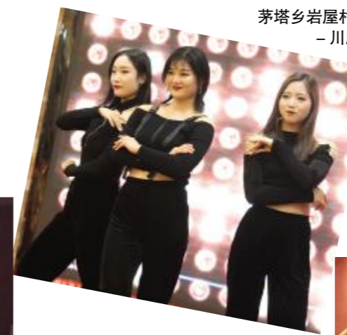
和昌项目部选送节目 - 舞蹈《Young@one》